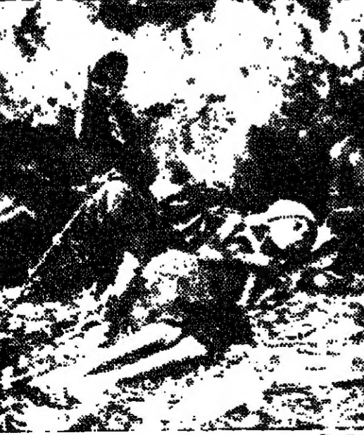
بين الموت والحياة